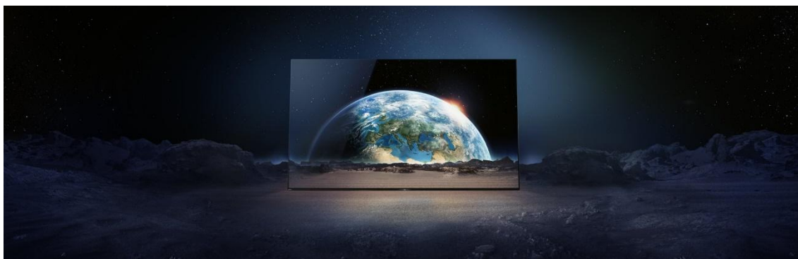
No detalhe, a nova Sony XBR A1E, que chega ao Brasil em outubro

O comportamento da sociedade está mudando em alta velocidade e, devido ao uso da tecnologia, percebemos um aumento da busca por telas cada vez maiores. A Sony, empresa japonesa pioneira em diversas tecnologias, acompanha essa evolução e tem investido em benefícios cada vez mais perceptíveis na qualidade de imagem e experiência de áudio principalmente nessas polegadas.