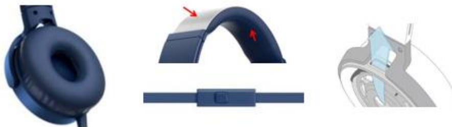
Detalhes do MDR-XB550AP, que estará disponível por R$ 299,99

Com tecnologia Extra Bass, ele realça as frequências mais baixas para obter sons graves mais profundos. Possui Cabo Flat anti embaraço e microfone com botão multifuncional integrado podendo atender chamadas e controlar a reprodução de músicas de smartphones. Seu sistema é compatível com Android e IOS.